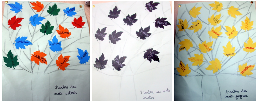
Réalisation d'arbres à mots par des GS (décembre)